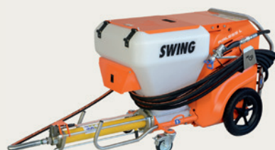
PFT SWING AIRLESS

Für die Verarbeitung mit Airless-Geräten von Spritzspachtel Plus eignen sich Airless-Geräte, deren Leistung auf die Verarbeitung von pastösen Spachtelmassen ausgelegt ist (z. B. Knauf PFT Swing Airless, Graco Mark V, VII, X, Wagner HC).